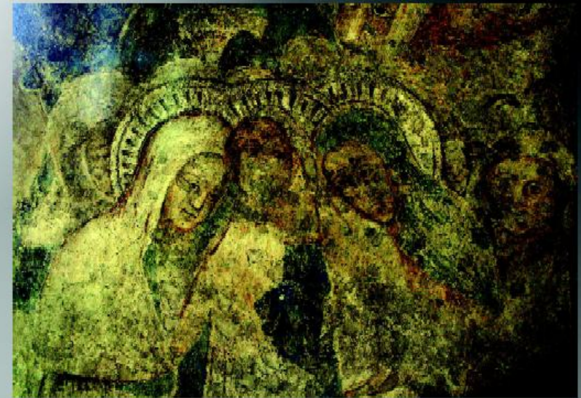
Görföl Jenő: Pelsőc temploma, siratóasszonyok

Iszél-járás • 2020. március • XIII. évfolyam 1. szám